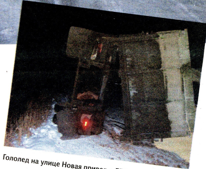
Гололед на улице Новая привел к ДТП с КамАЗом