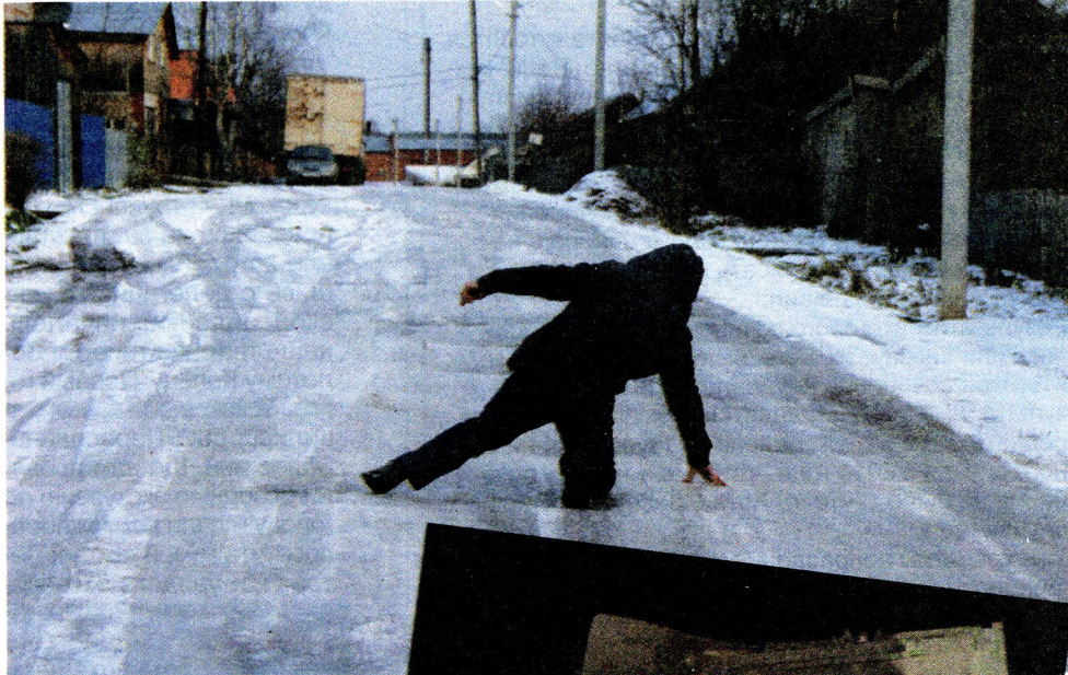
Нет такой улицы в Кезу в эти дни, которая не представляла бы опасность для пешеходов

А 18 ноября в Кезу на улице Новая, что при выезде на Кулигу, случилось происшествие как яркая иллюстрация того, что бывает, когда проезжая часть, и без того пребывающая не в лучшем состоянии, в сложных погодных условиях превраща-